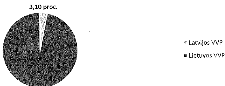
3 paveikslas. Investicinio portfelio sudėtis pagal emitentus, procentais.

5.2. Indėlių draudimo fonde sukauptomis lėšomis ataskaitiniu buvo dengiami skoliniai įsipareigojimai Lietuvos Respublikos finansų ministerijai, todėl investavimo veikla nebuvo vykdoma šio fondo atžvilgiu.